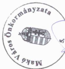
Farkas Éva Erzsébet polgármester